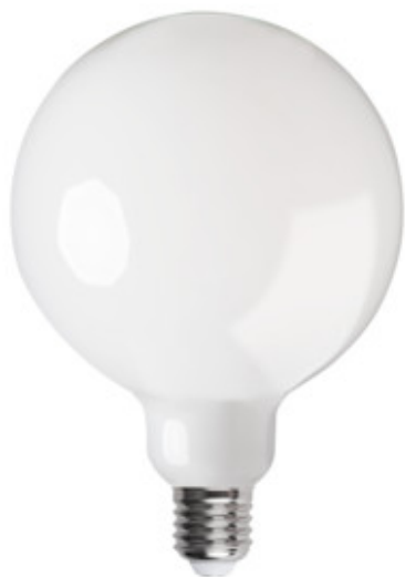
XLED G125 11W