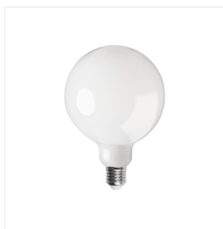
XLED G125 11W