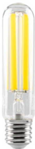
XLED HP D46E40 38W-NW