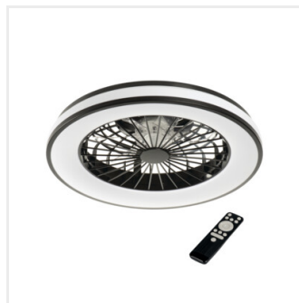
PLAVE LED CCT+RGB