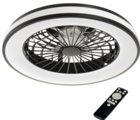
PLAVE LED CCT