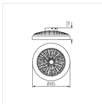
PLAVE LED CCT