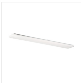
LINCEA 30-45W 12 CCT