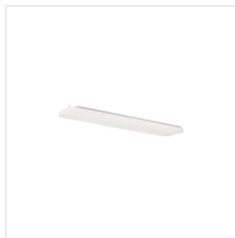
LINCEA 15-24W 07 CCT