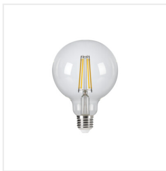
XLED G95C 7,8W-NW