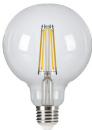
XLED G95C 7,8W-NW