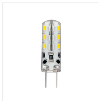
TANO G4 SMD-NW