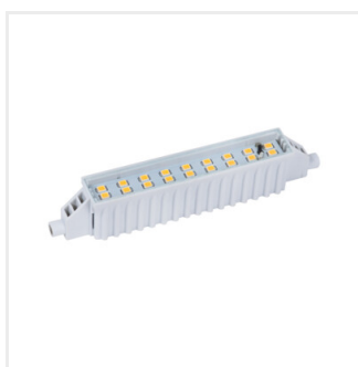
RANGO R7S SMD