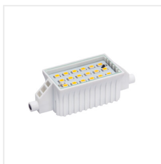
RANGO MINI R7S SMD-WW