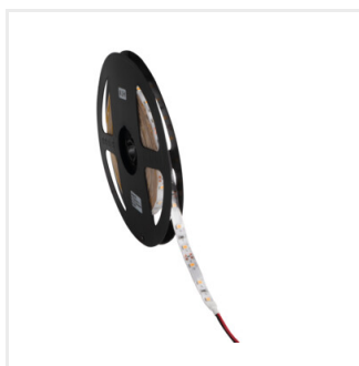
LEDS-B 4.8W/M IP65