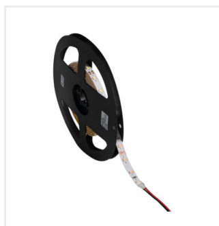
LEDS-B 4.8W/M IP00