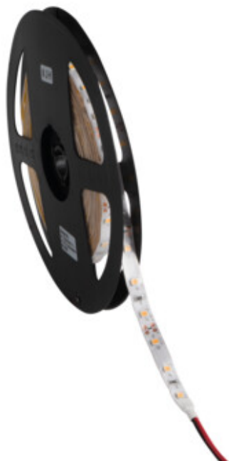
LEDS-B 4.8W/M IP65