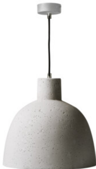
OGIVA D35 GR