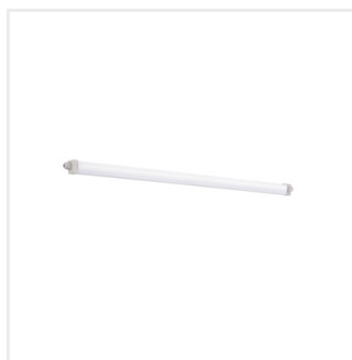
TP SLIM TW LED 50W-NW