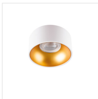
MINI RITI GU10 W/G