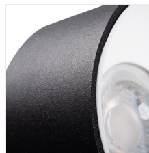
MINI RITI GU10 B/G