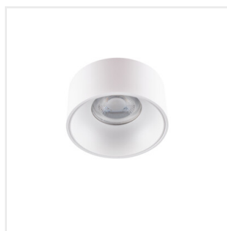
MINI RITI GU10 W/W