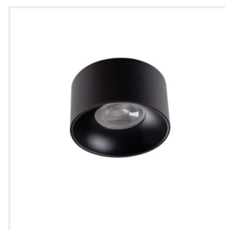
MINI RITI GU10 B/B