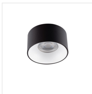
MINI RITI GU10 B/W