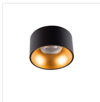
MINI RITI GU10 B/G