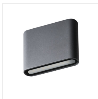
GARTO LED EL 8W-GR