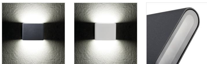
GARTO LED EL 8W-GR