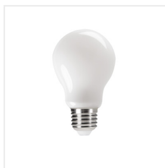
XLED A60M 4,5W, XLED A60M 7W, XLED A60M 8W, XLED A60M 10W