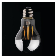
XLED A60 M 7W-WW