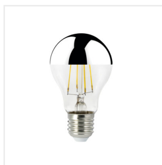
XLED A60 M 7W