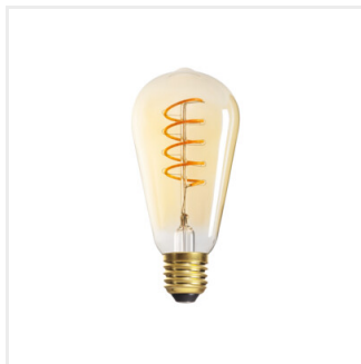
XLED ST64 4W-SW