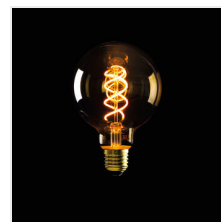
XLED G95 5W-SW