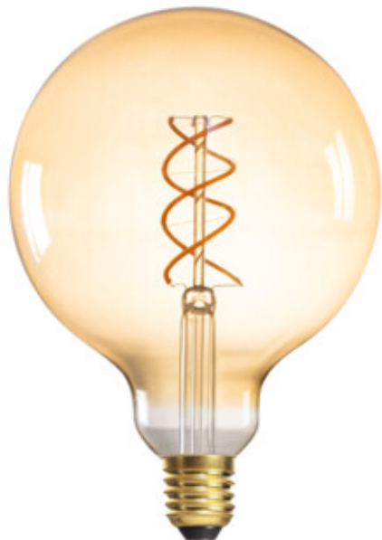
XLED G125 4W-SW