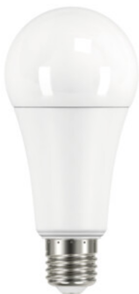
IQ-LED A67 N 19W-WW