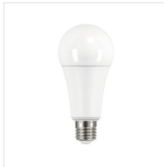
IQ-LED A67 N 19W-NW