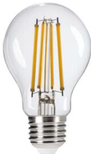
XLED EX A60 4W-WW