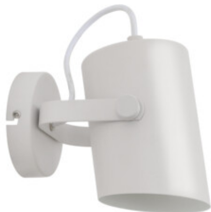
LARATA EL-10 W