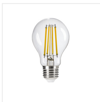
XLEDIM A60 E27 11W-NW