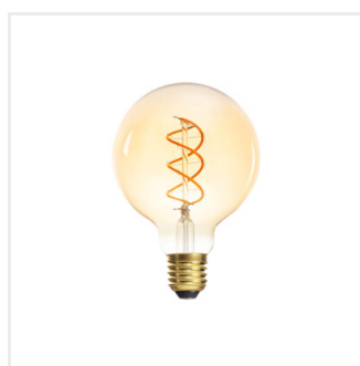
XLED G95 5W-SW