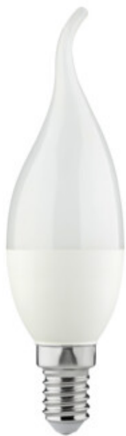
IDO 6,5W E14-WW