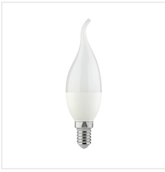
IDO 6,5W E14