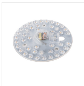
MODv2 LED 19W