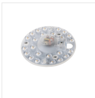
MODv2 LED 12W