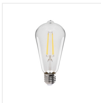
XLED ST64C 7W