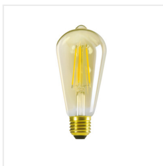
XLED ST64 7W