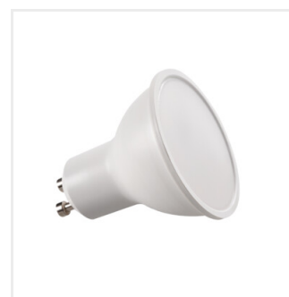
TOMiv2 6,5W GU10