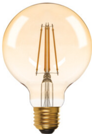
XLED G95 7W-WW