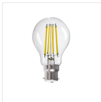
XLEDIM A60 B22 12W-CW