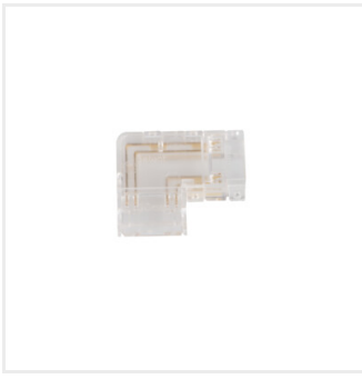
CON P 10 RGB L