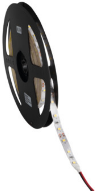
LEDS-B 4.8W/M IP65