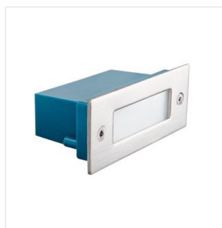
TAXI SMD P C/M-NW