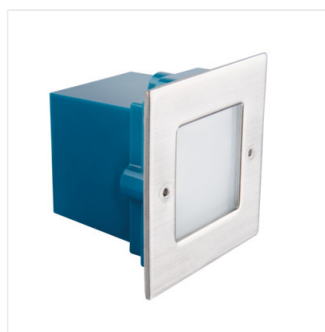
TAXI SMD L C/M-NW