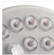
MODv2 LED 19W