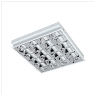
RSTR N 418/4LED/PT-H