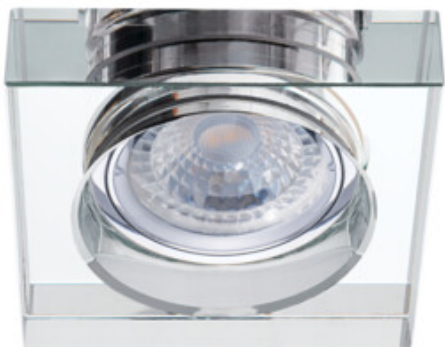
MORTA B CT-DSL50-B