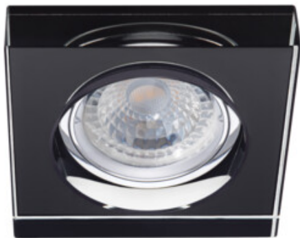
MORTA B CT-DSL50-B