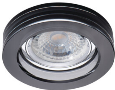
MORTA B CT-DSL50-B