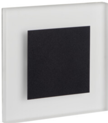
APUS LED B, APUS LED AC B