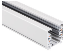
33232 TEAR N TR 2M-W

Komponent lištového systému, TEAR N TR 2M-W, 3-fázová lišta, bílá, (33232)