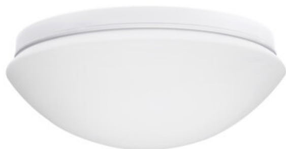
PIRES DL-600 NS