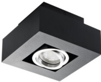
STOBI DLP 50-B