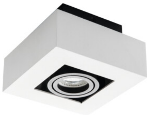
STOBI DLP 50-W