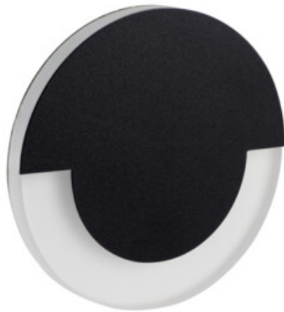
SOLA LED B