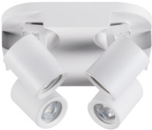
LAURIN EL-40 W