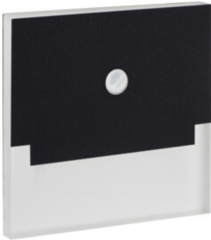
SABIK LED PIR B