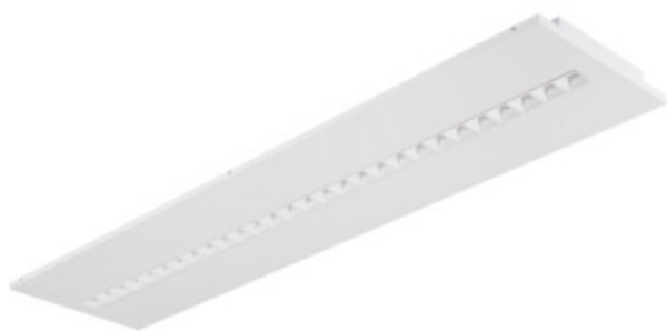
OS RST W P3