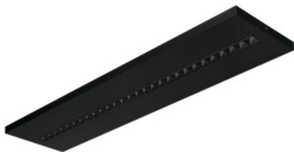
OS RST B N3