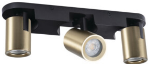
LAURIN EL-3I B-G