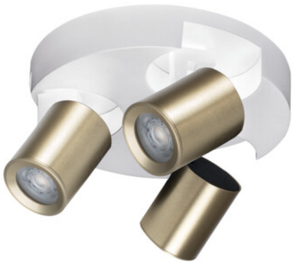
LAURIN EL-30 W-G