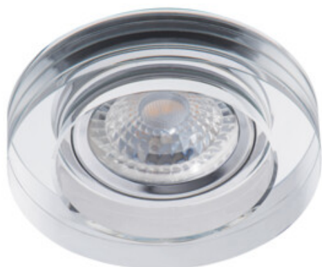
MORTA B CT-DSL50-B