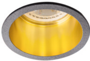
SPAG D B-G